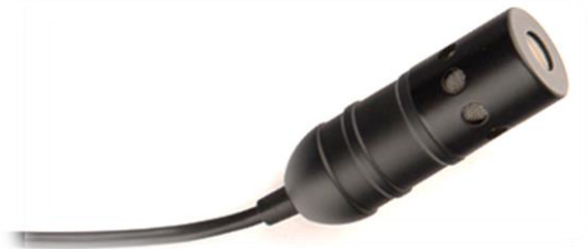
Cellule Série 21 Lanen

Cet ensemble de quatre micros DL21 Salmiéri est utilisable sans fil grâce au système UHF DSP B210 Prodipe (vendu séparément).