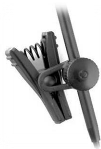
SB21 Lanen / PL21 Salmiéri

La fixation du micro Série 21 Lanen à votre instrument, ainsi que son positionnement, sont les conditions essentielles pour une prise de son de qualité. Notre gamme de clamps adaptés aux instruments permet d'offrir le meilleur compromis possible entre position et discrétion.